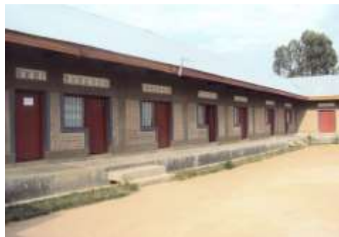
Bâtiment fini à Ariwara, Novembre 2008