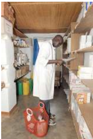
Vu de la section magasin dans le dépôt d'Ariwara

A Ariwara le dépôt est hébergé dans un bâtiment de l'Hôpital Général d'Ariwara.