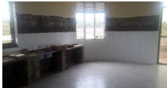
Salle de Laboratoire Mars 2022