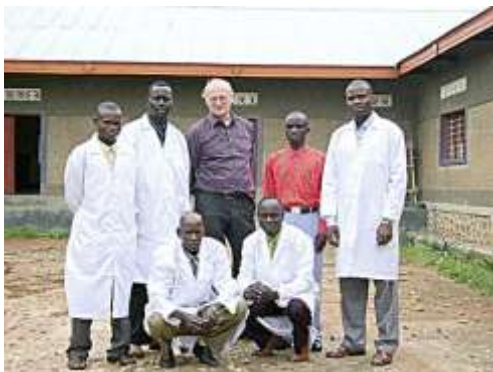
L'équipe du dépôt d'Ariwara devant le nouveau bâtiment.