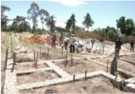
Début de travaux de construction à Mahagi, Mai 2007

En 2007 la Caritas diocésaine reçoit un fond et lance la construction de deux bâtiments de magasin, à Mahagi d'abord, et puis à Ariwara pour un bon fonctionnement de la CDR qui a déjà gagné de volume de distribution dans sa région de couverture bien définie.