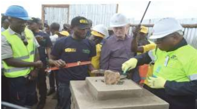
Pose de première pierre par l'Administrateur du Territoire d'Aru, 14.2.2020

L'assemblée générale également approuve les plans du bâtiment et de financer la construction par les fonds propres de l'association, et en janvier 2020, les travaux commencent sur le terrain propre de l'association. La pose de première pierre se tenait en Février 2020.