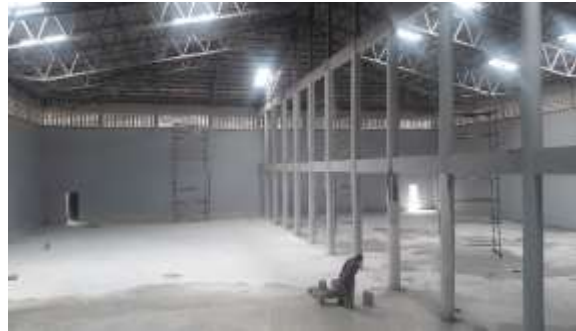
Magasin principal Mars 2022