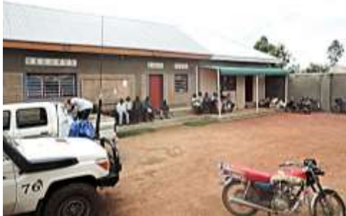
Salle de livraison fini à Ariwara, Février 2011