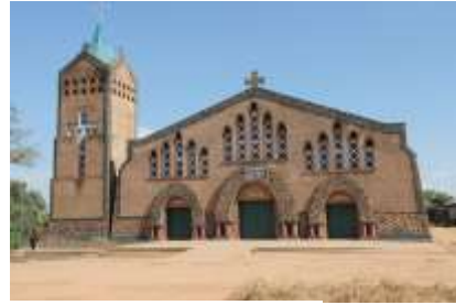
Cathédrale de Mahagi

Vu de l'intérieur du bâtiment à Mahagi : Partie droit est le bureau de Malteser International Partie gauche et le dépôt pharmaceutique