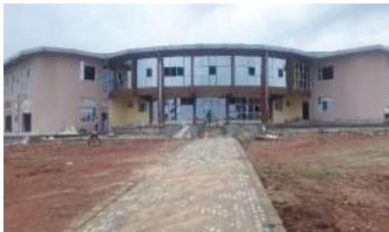
Entrée principale et bureaux Mars 2022

Il est notre fierté qu'on a achevé cette œuvre avec notre propre fond seul!