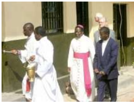
Inauguration et Consécration du bâtiment à Mahagi, Février 2008