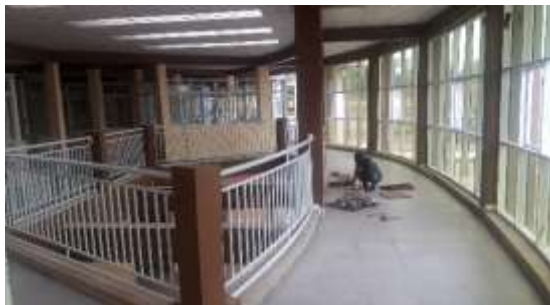
Étage bureaux Mars 2022