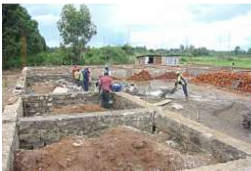
Début de travaux de construction à Ariwara, Aout 2008