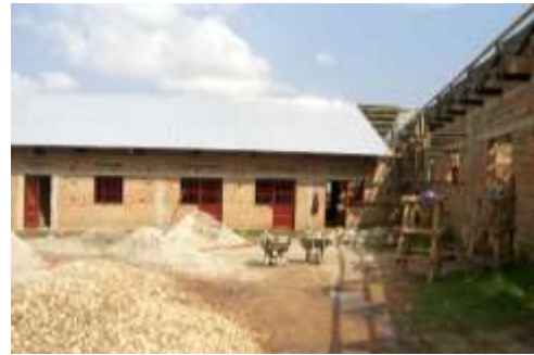
Finissage de construction à Mahagi, Septembre 2007