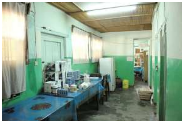
La section livraison aux clients au dépôt d'Ariwara